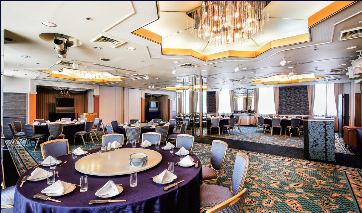
おおとり(ロビー階)