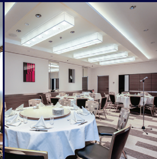
スペースシャトル(ロビー階)